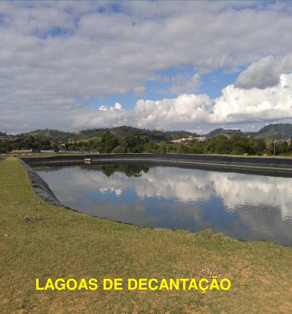
LAGOAS DE DECANTAÇÃO