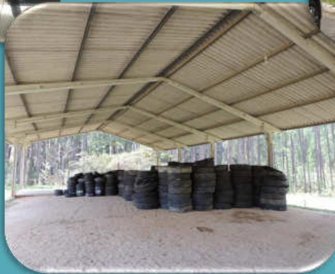
COLETA DE PNEUS