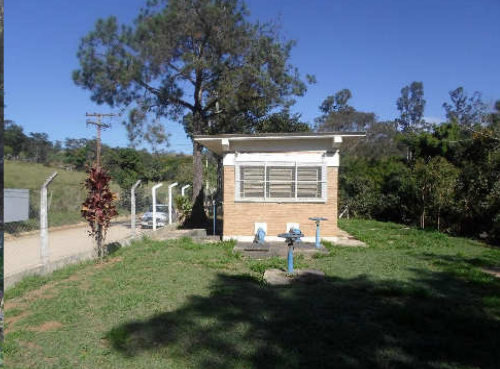
Captação Arcadas – ETA IV Córrego dos Mosquitos