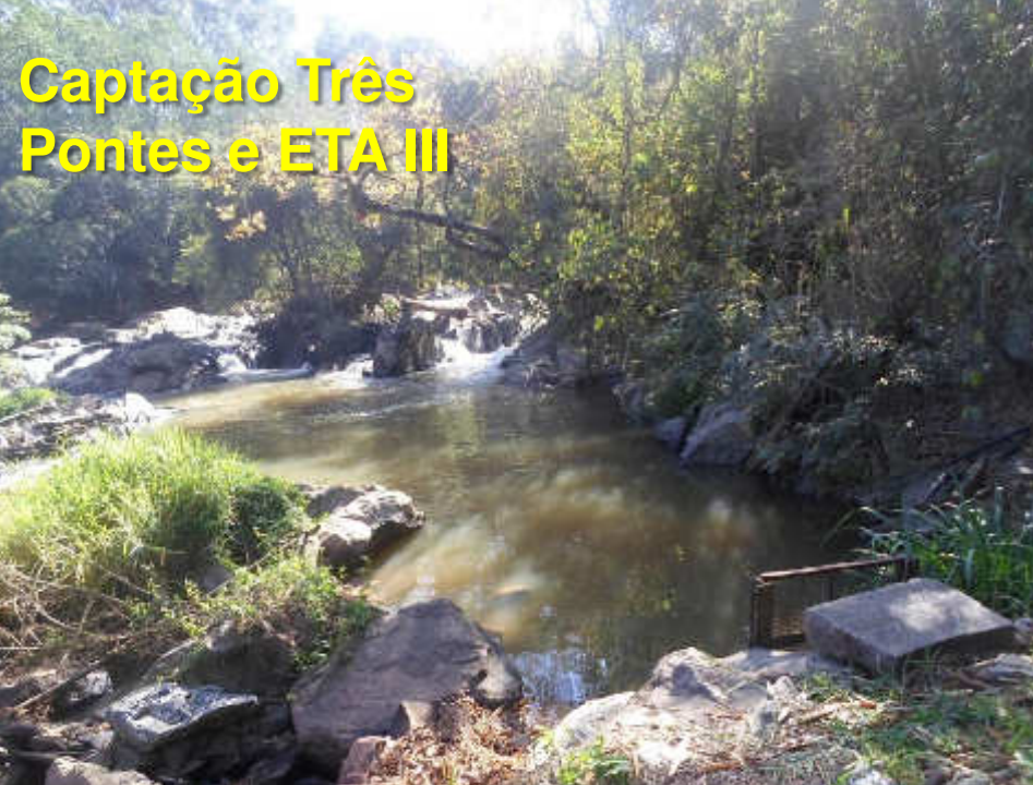
Captação Três Pontes e ETA III