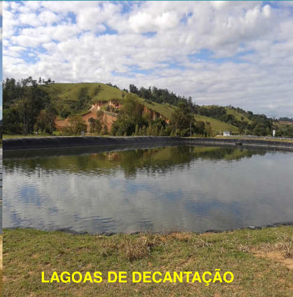
LAGOAS DE DECANTAÇÃO