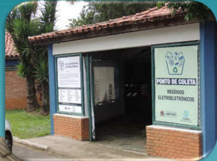
COLETA DE ELETRONICOS