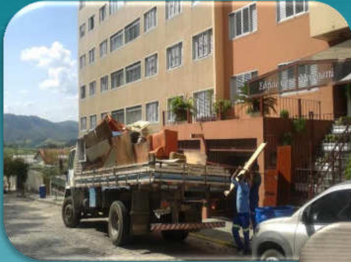
COLETA DE VOLUMOSOS